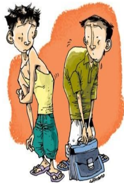
Hình ảnh: Cong cột sống