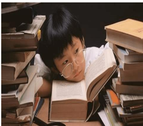
Sử dụng mắt nhìn gần: Đọc sách, đọc truyện quá nhiều trong thời gian dài không có thời gian thư giãn.

- Bàn ghế không phù hợp với lứa tuổi học sinh, bàn quá cao làm cho mắt gần với sách vở, tư thế sai khi ngồi học (cúi gằm, nhìn gằm).