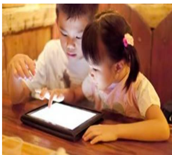
Yếu tố thể trạng: Trẻ gầy yếu, hay ốm đau dễ bị cận thị hơn trẻ khỏe mạnh.